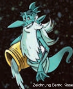
Zeichnung Bernd Kissel

Referent: Bernd Kissel (Karikaturist, Comiczeichner, Trickfilmdesigner)